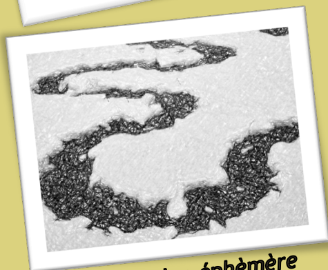
La rivière éphémère